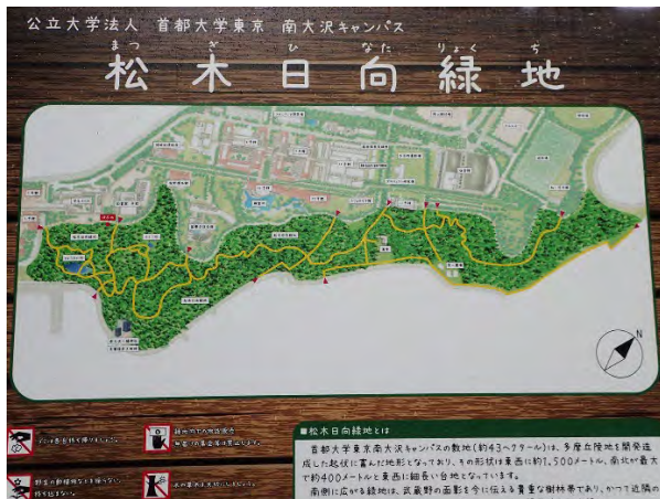
松木日向緑地看板