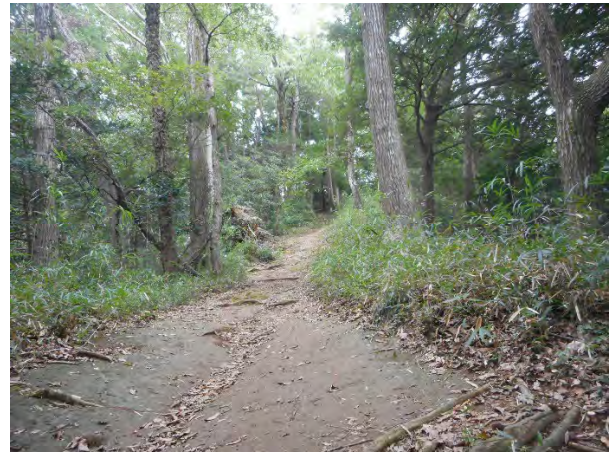
山頂近くの尾根道