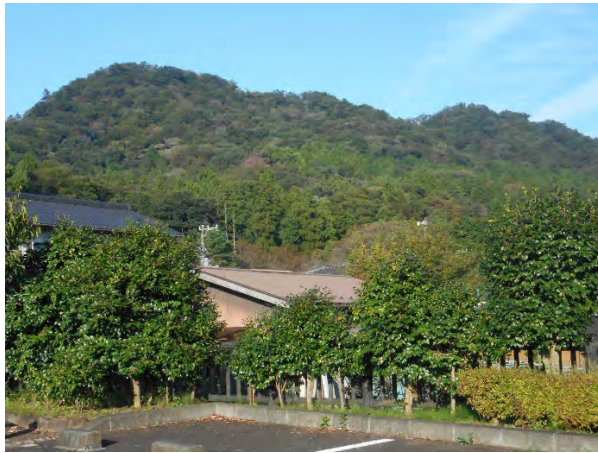
駐車場から見上げた城山